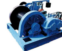
JM6吨慢速卷扬机 绳速：10m/min 容绳量：90米 低速端配带式制动器