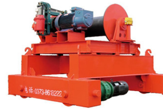
JC80吨工程门式起重机小车 起重量：80吨 起升速度：0.8m/min 起升高度：21m 小车轨距：2.5m