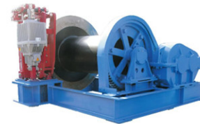
JM10吨慢速卷扬机拉力100KN 绳速：9.5m/min 容绳量：300米 中铁大桥局80吨门式起重机用