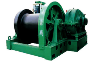
JM12.5吨变频双速卷扬机 变频调速，配低速端带式制动器用于中铁大桥局 高速铁路JQ900吨下导梁架梁机