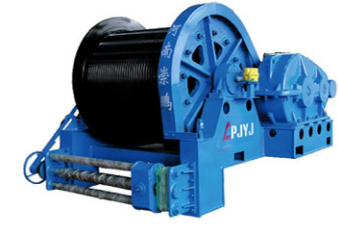
JM8吨慢速卷扬机 绳速：12m/min 容绳量：380m 郑州大方桥梁提梁机用